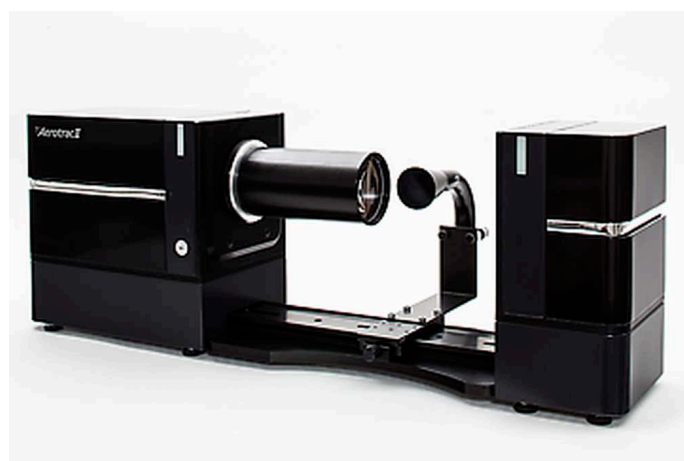
Pomiar na sucho