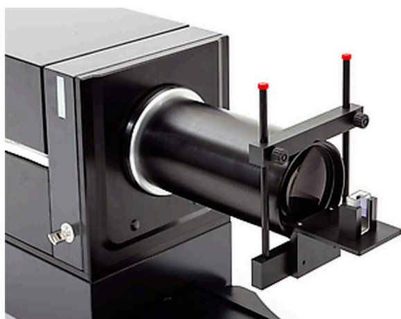
Pomiar na mokro przy użyciu celi wsadowej

Mocowanie przyrządów do obsługi różnych rodzajów sprayów